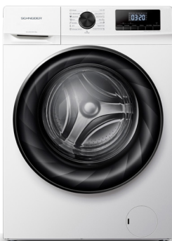
Lavadora frontal 12 kg SCLLF1214VAW 699,99 €

Velocidad de centrifugado (Max): 1400 rpm • Temperaturas: 20-40-60-90 °C • Parada diferida • Número de programas: 15, Alergias (Vapor), Ropa de bebé (Vapor), Eco 40-60°C, Rápido 15 min, Algodón Color, Mixto, Algodón, Colores oscuros, Camisetas, Lana, Deporte, Limpieza del tambor a 90°C, Centrifugado, Aclarado + Centrifugado, Prelavado, Aclarado extra • Seguridad infantil • Motor Inverter • Clase acústica (centrifugado): A • Nueva clase energética: A • Consumo de energía por ciclo: 0,51 kWh • Consumo de agua por ciclo: 42 L.