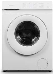
Lavadora SLIM frontal 7 kg SCLLF7120 499,99 €

¡DISTINTAS CAPACIDADES PARA DISTINTAS NECESIDADES!